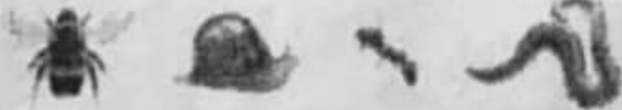
زنبور حلزون مورچه کرم خاکی

الف: با در نظر گرفتن صفات ظاهری جانوران زیر را طبقه بندی کنید و کلید شناسایی دو راهی برای آنها طراحی کنید. (کرم خاکی، مورچه، حلزون، زنبور)